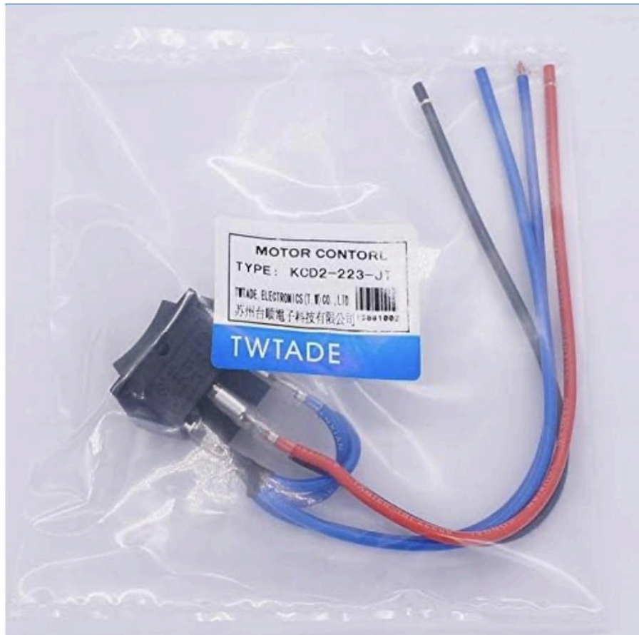
Figure 2: Les fils connecté du commutateur